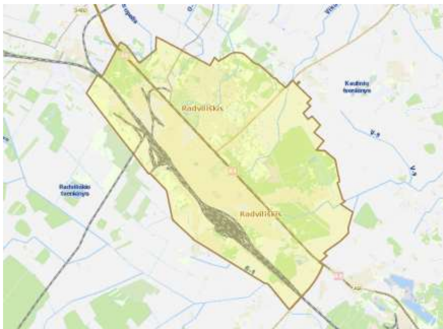
1 pav. Radviliškio miesto teritorija

Radviliškio rajono savivaldybė yra administracinis teritorinis vienetas, priklausantis Šiaulių apskrčiai. Savivaldybės centras – Radviliškio miestas, 21 km į pietryčius nutolęs nuo Šiaulių. Radviliškio rajone yra 2 miestai (Radviliškis ir Šeduva), 10 miestelių bei 420 kaimų. Bendras teritorijos plotas 1 635 km 2 , Radviliškio miesto teritorija užima 1732,2 ha plotą. Radviliškio miestas apie 20 km į pietryčius nutolęs nuo Šiaulių, apie 180 km nuo Vilniaus, 140 km nuo Kauno, 180 km nuo Klaipėdos (žr. 1 pav.).